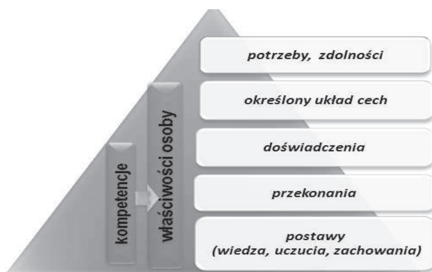
Rycina 1. Komponenty kompetencji

Źródło: opracowanie własne, por. A. Popławska, Kompetencje podmiotowe uczniów wyznacznikiem dobrego funkcjonowania w dynamicznej współczesności , [w:] A. Harbatski, E. Krysztofik-Gogol (red.) Edukacja w perspektywie wyzwań współczesności , Toruń 2016, s. 55.